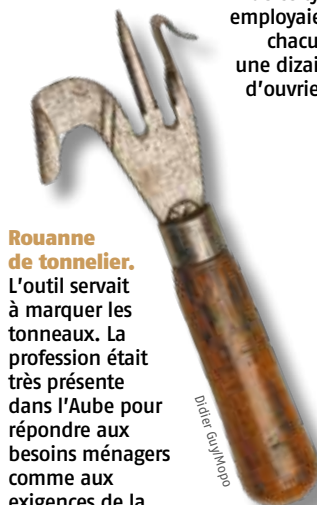
Rouanne de tonnelier. L'outil servait à marquer les tonneaux. La profession était très présente dans l'Aube pour répondre aux besoins ménagers comme aux exigences de la production viticole.

À la fin du XIX e siècle, l'Aube est l'un des départements les moins peuplés de France — le 76 e d'après le recensement de 1872, avec 255 687 habitants. On y compte 43 habitants au kilomètre carré, contre 70 en moyenne en France. Avec deux tiers de sa superficie en terres labourables, le département est très agricole. Excepté dans les cantons de Nogent-sur-Seine et de Romilly-sur-Seine, couverts par de grandes exploitations, « il y a beaucoup de petits cultivateurs dont le plus grand nombre est propriétaire », rapporte Adolphe Jouanne dans sa Géographie de l'Aube (1874). Ces derniers cultivent les grains de toute espèce, les légumes et le chanvre. Il y a aussi beaucoup de bergers, privés ou com-