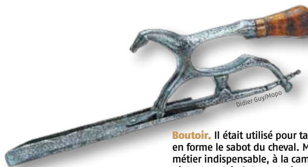
Boutoir. Il était utilisé pour tailler la corne et mettre en forme le sabot du cheval. Maréchal-forgeron, un métier indispensable, à la campagne, à une époque où le cheval était la seule énergie motrice.