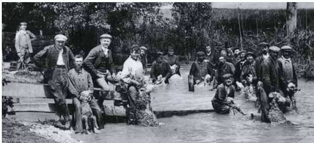
Trouans, le lavage des moutons. Suivait la tonte, de mai à juin.