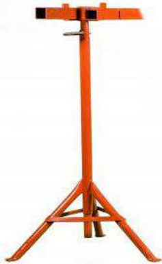
Pied de poule