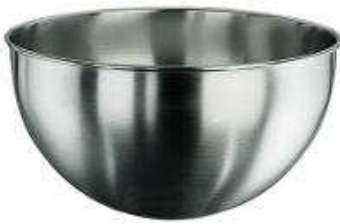
Cul de poule

Avec Pascal MARCILLY nous terminons (provisoirement ?) l'exploration du monde des oiseaux qui se sont "invités" dans nos ateliers... (voir Gazettes N°12, 13 & 14),