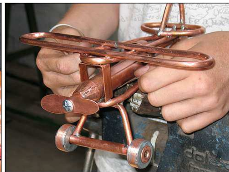
Chandelier et avion à l'atelier "plomberie".